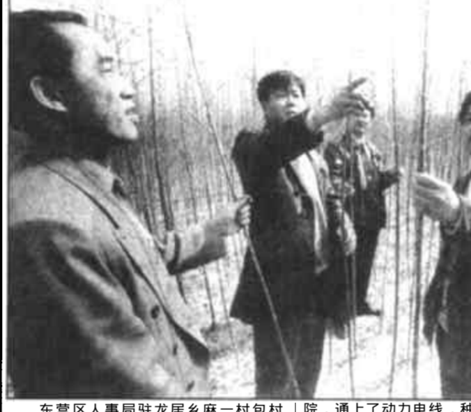
东营区人事局驻龙居乡麻一村包村组驻村两年来,先后协调、投入资金40万元,为该村新建库容3万立方米的水库一座,建起了扬水站、盖上了文化大院,通上了动力电线,种上了10亩树苗,两年来人均增收超千元。图为该局领导在苗圃察看树苗生长情况。

河口讯 今年以来,河口区个体私营经营者思想观念发生大变化,他们正确处理消费与经营的关系,思想观念有了很大变化:情感投资愈来愈小,扩大经营的投入愈来愈大。截至目前,全县4613家个体私营户用于扩大经营投资比去年同期增长46.3%,注册资金达到8280万元,不正常消费减少了15万余元。 随着市、区发展个体私营经济优惠政策的相继出台,全区个体私营经济收入不断提高,有些个体私营户出现了盲目消费现象,为亲朋好友随份子、婚丧嫁娶处处讲气派,档次越来越高,少则50元,多则几百上千元,不仅花掉了